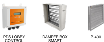
PDS LOBBY CONTROL